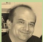
Člen Rady TDN, externí pracovník, revizor