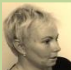
Dobrovolnice DC ADRA Ostrava