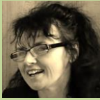
Vedoucí Dobrovolnického centra ADRA Ostrava