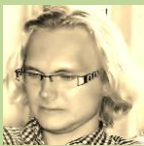
Dobrovolník DC ADRA Ostrava