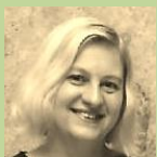
Předsedkyně TDN, pracovnice v sociálních službách, hospodářka