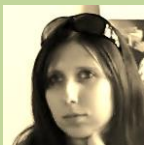
Dobrovolnice DC ADRA Ostrava